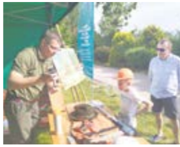
Mundurowy Piknik w Radlinie