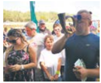
VIII Rajd Fortuny