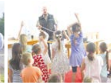
Festyn rodzinny w Poznaniu

nego Rajdu Rowerowego” RoweLOVE w okolicy Jarocina. Na mecie, placu Komendy Powiatowej Państwowej Straży Pożarnej w Jarocinie rozdaliśmy kolejne setki sadzonek drzew. Chętnych nie brakowało, co nas osobiście bardzo ucieszyło. Mnóstwo uczestników rajdu zabrało na pamiątkę drzewka, by później móc zasadzić je na własnym ogródku lub w swojej najbliższej okolicy.