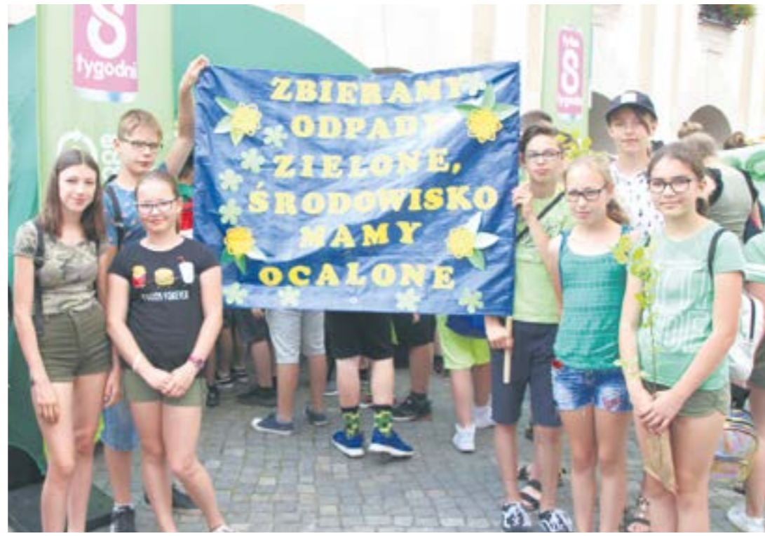
Piknik ekologiczny na jarocińskim rynku