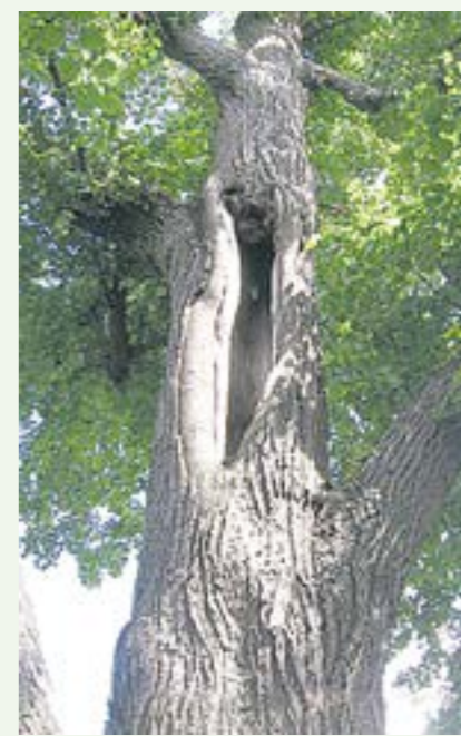
Lipa z Cielętnik przed 2017 rokiem

I nic w tym dziwnego, skoro w kalendarzu lipiec - miesiąc znany z tego, że to teraz przepięknie kwitną powszechnie lubiane u nas lipy. Są wysokimi, dorodnymi drzewami, o gęstej, rozłożystej i harmonijnie zbudowanej koronie. Rosną na terenie umiarkowanej strefy półkuli północnej. Znanych jest około 20 gatunków, ale w Polsce w stanie dzikim rosną tylko dwa gatunki. Wyglądają pięknie, zarówno jako pojedyncze drzewa, jak i posadzone w szpalerach. Stare drzewostany lipowe są dzisiaj rzadkością. Interesujące okazy częściej można spotkać w parkach, alejach, przy drogach, niż w zwartych drzewostanach. Dawniej były drzewami dominującymi w każdej wsi. Obsadzano nimi tereny wokół pałaców, dworów, kościołów, aleje spacerowe i drogi dojazdowe. Taką aleję, o długości 350 m, obsadzoną lipą drobnolistną, można podziwiać w parku Ośrodka Kultury Leśnej w Gołuchowie. Powstała w 1856 r. i jest zaliczana do grupy najpiękniejszych alei parkowych w Polsce.