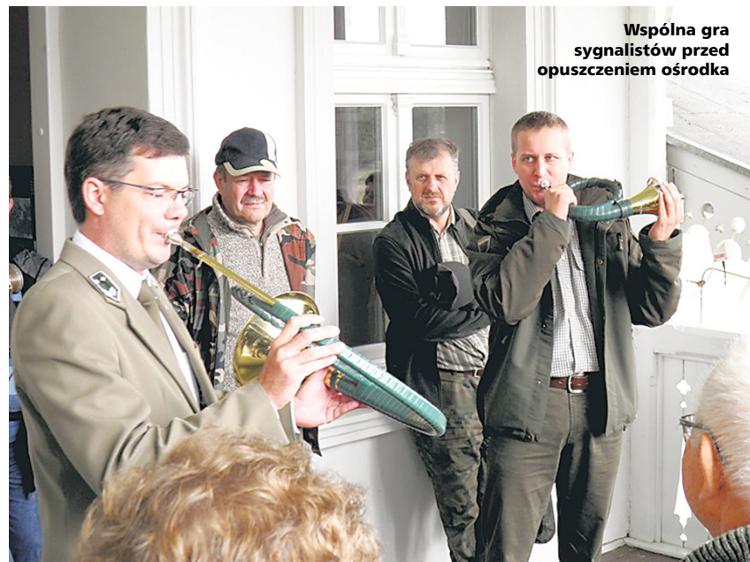
Wspólna gra sygnalistów przed opuszczeniem ośrodka