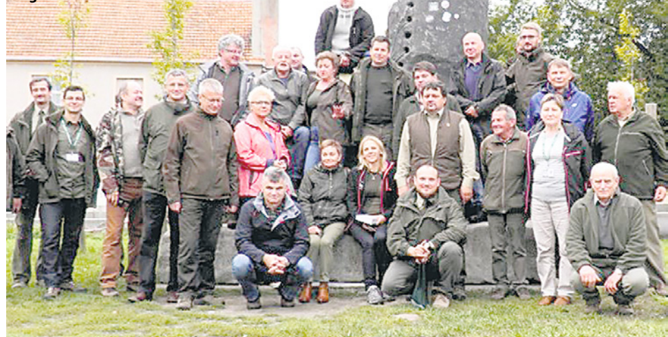
Zdjęcie delegatów z glanm w tle

Państwo o powierzchni 316 km 2 , ze stolicą w La Valetta, jest nie tylko najdalej wysuniętym na południe w Europie, ale również krajem o największej na świecie gęstości zaludnienia - ok. 940 osób/km 2 . Jest ponadto jednym z najmniejszych państw świata leżącym na Morzu Śródziemnym. Poprzez wody terytorialne Morza Śródziemnego od północny graniczy z Włochami, a jej linia brzegowa wynosi 140 km. Od włoskiej i nie mniej słonecznej Sycylii dzieli ją zaledwie drogą morską 81 km (na południe). Uważa się, że Malta jest drugim najbezpieczniejszym państwem na świecie, jeśli chodzi o prawdopodobieństwo wystąpienia klęski żywiołowej.